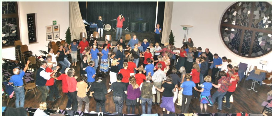
Offener Tanzabend im Piccardsaal

Täglich mind. 3 Std. vor- oder nachmittags Unterricht, ein freier Tag für wahlweise gemeinsame Unternehmung, öffentliche Tanzabende, Abschlussveranstaltung an einem schönen Ort.