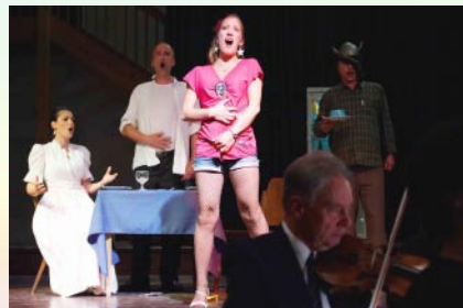
Aufführung der Oper 2010 “Le Docteur Miracle” von Bizet